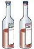
Flacon aérobic Flacon anaérobic